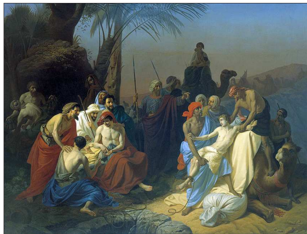
Iosif este vândut de către frații săi mai mari (Pictură de Konstantin Flavitsky, 1855)

La început a fost ura, iar apoi au uneltit moartea, care însă nu s-a materializat, ea fiind substituită de vinderea lui unor madianiți. Iosif, adolescentul neînțeleș, nu găsește nici o ușă de a fi acceptat. Grupul are regulile lui iar dacă nu i te supui ești eliminat cu cruzime.