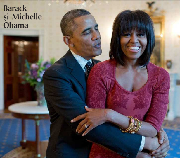
Barack și Michelle Obama

că, imediat cum se trezește la 5.00 dimineața, răspunde la e-mailuri sau face sport. „În mod normal, aș începe să trimit e-mailuri imediat cum mă trezesc. Dar nu toată lumea are același program ca mine, așa că trebuie să aștept până la ora 7.00. Înainte de ora aceasta, fac sport, citesc sau folosesc produsele noastre”, a explicat el pentru „The Guardian”.